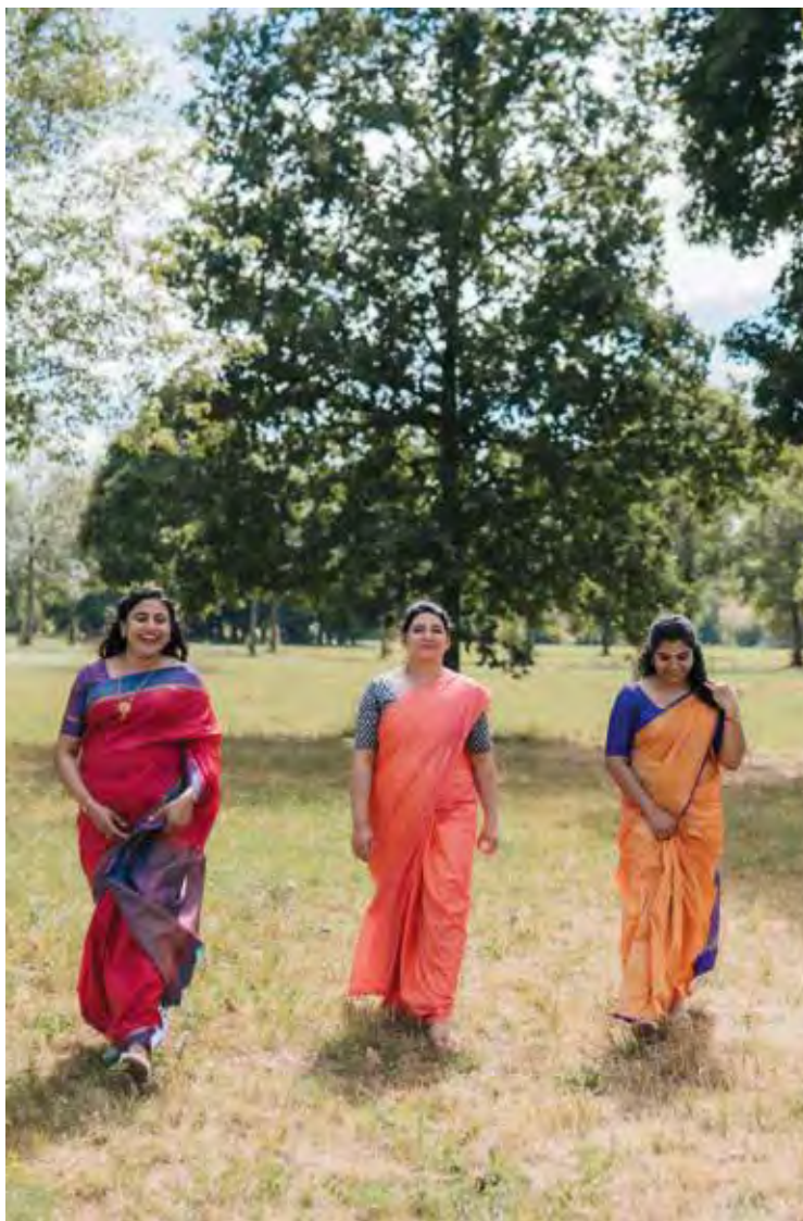
DONA FRANCIS B.A.M.S & IHR AYURVEDA- MEDIZINERINNEN- TEAM