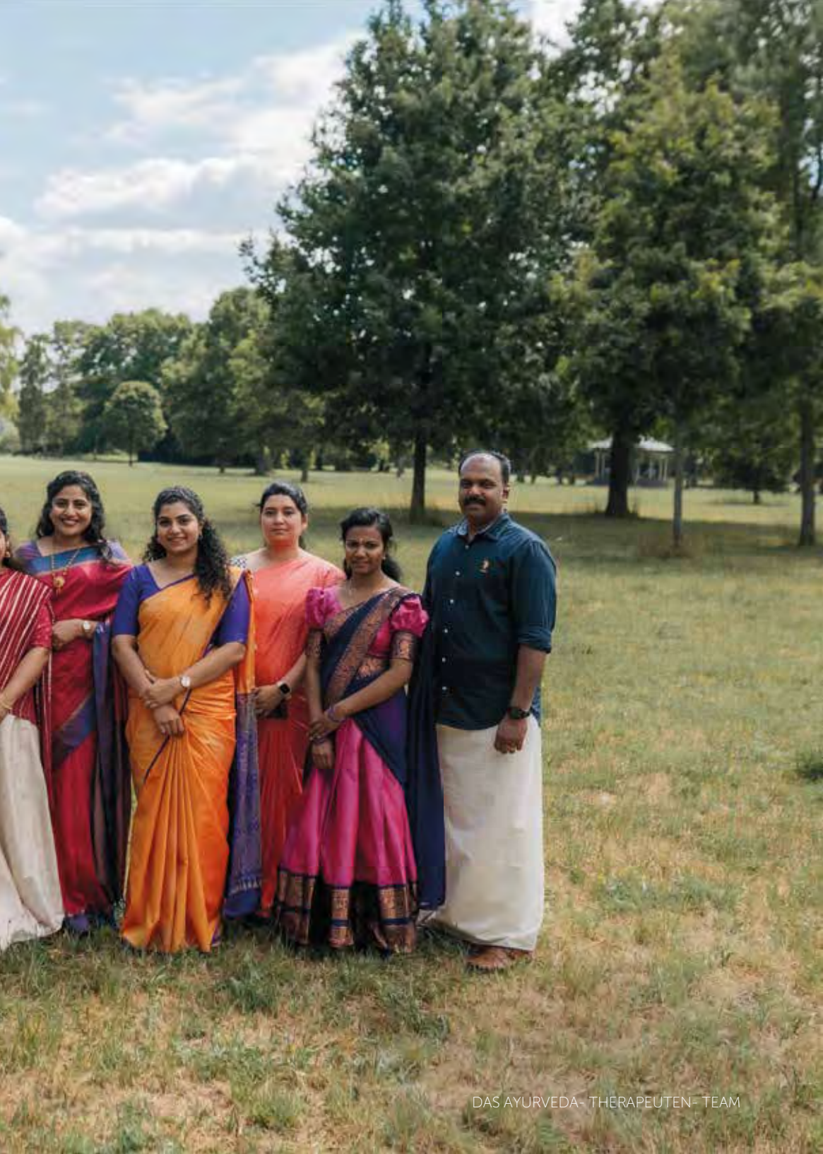
DAS AYURVEDA- THERAPEUTEN- TEAM