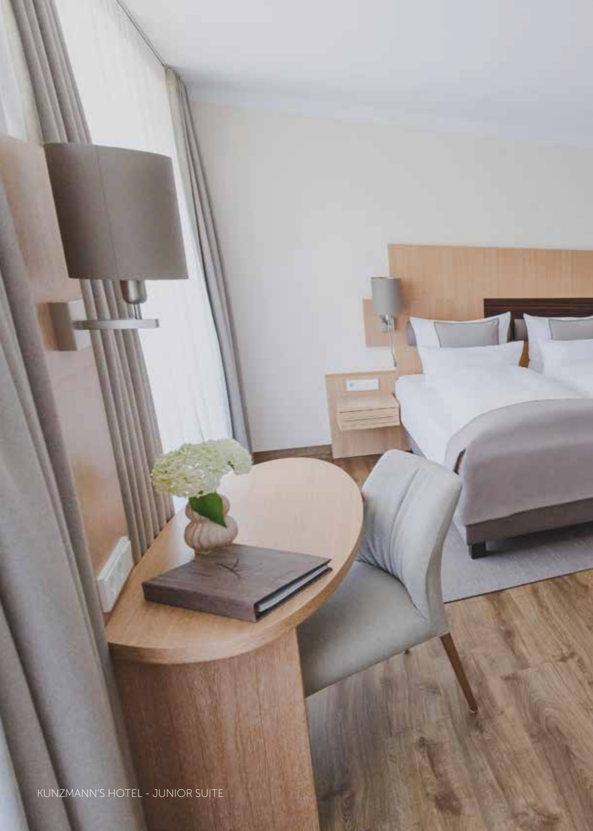
KUNZMANN'S HOTEL - JUNIOR SUITE