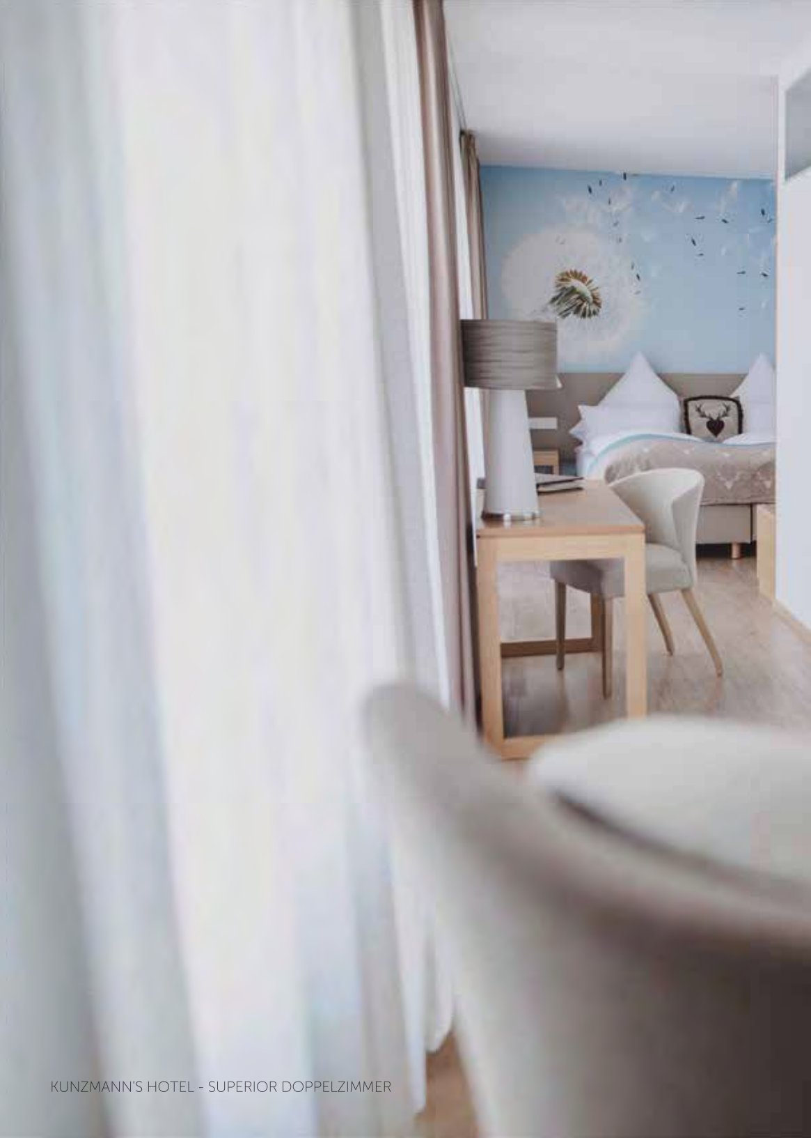
KUNZMANN'S HOTEL - SUPERIOR DOPPELZIMMER