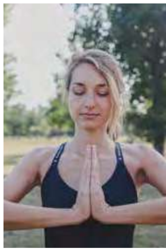
DER ANGRENZENDE PARK AN DAS KUNZMANN'S HOTEL - RUHE & NATUR